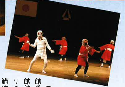
▲ ひょっとこ踊り 美浜同好会