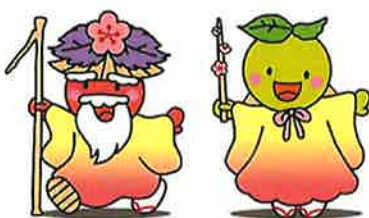
福井梅マスコットキャラクター 「ふくい梅じい」&「わかさ梅ぼう」